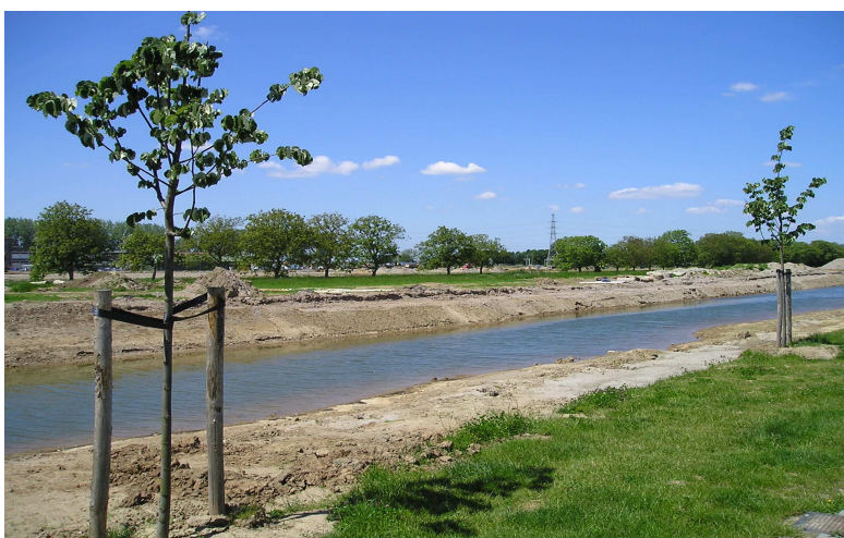
Laauwick-Noord: Locatie op het eiland vlakbij de te realiseren recreatieplassen en met uitloop naar park