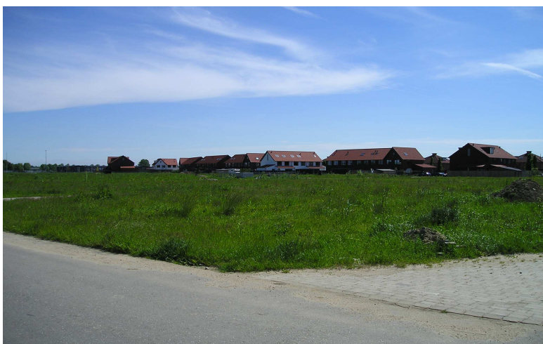
Nijland-West: Achteraan in Nijland, vlakbij het winkelcentrum en de busbaan en met uitzicht op de weilanden rond Oosterhout