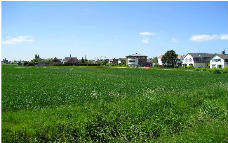
De Stelt: Locatie net achter de dijk, dichtbij de brug naar Nijmegen en met uitloop naar de rivier.

Via kwam Christine in contact met ProperStok, een Rotterdams bureau dat gespecialiseerd is in het verbeteren van achterstandswijken. Zij hebben in opdracht van de gemeente Nijmegen en in samenwerking met een landschapsarchitect een visie gemaakt voor Dukenburg en de Beerendonck. Onderdeel van deze visie is het ontwikkelen van een stukje land dat tussen de Graafseweg, Tolhuis, het stadspark Staddijk en de A73 in ligt. Nu staan daar twee scholen en wonen er woonwageneigenaren maar ProperStok wil in samenwerking met Standvast daar een nieuw wijkje